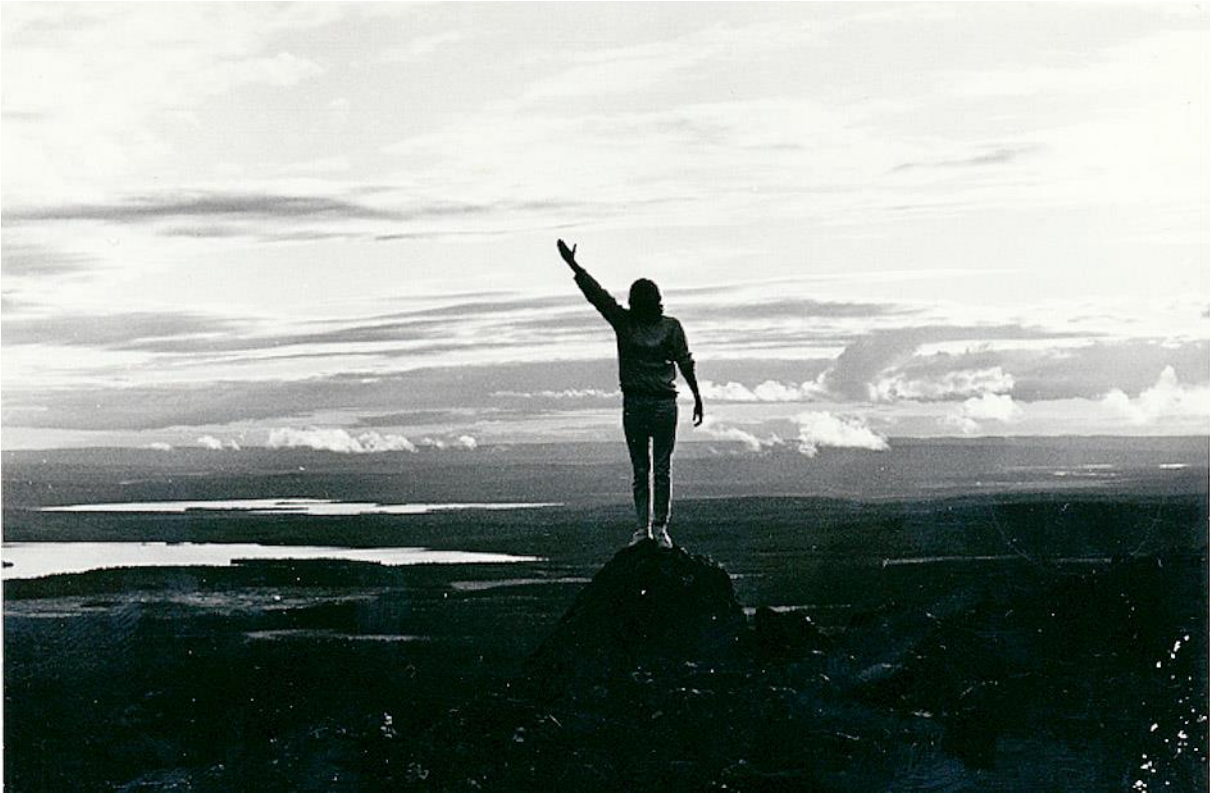
Huippuhetki. Tässä tapauksessa Pallaksella.

Halveksitut autopalstat olivat päässeet päivälehtiinkin yksinkertaisesti siksi, että oli lukijoita joita autot kiinnostivat... Ei nyt sentään – totuuden nimessä suurempi vaikutus on ollut sillä, että niin maahantuoajat kuin paikalliset autoliikkeetkin olivat varsinaisia lehtien ilmoitustulojen rahasampoja.